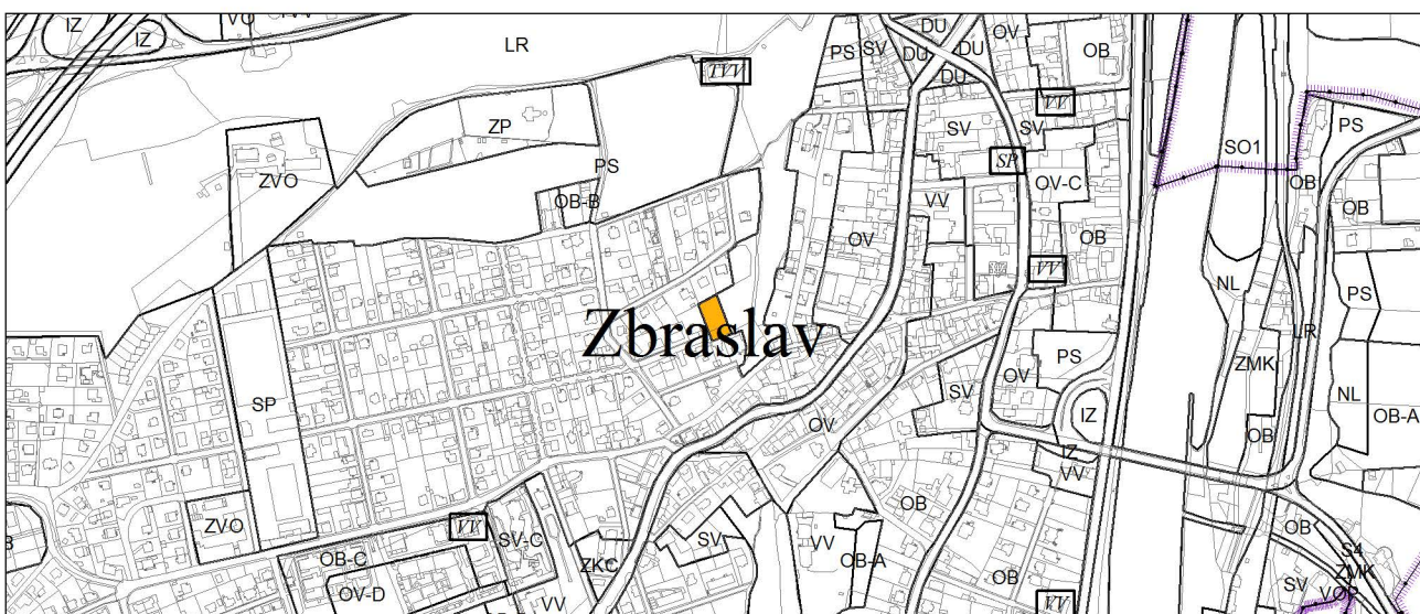
Zákes zadání změny schválený usnesením ZHMP č. 38/74 ze dne 14. 6. 2018